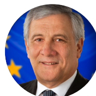
Antonio Tajani Vorsitzender des Europa- parlaments 2017 – 2019