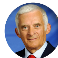
Jerzy Buzek Vorsitzender des Europa- parlaments 2009 – 2012, Ministerpräsident Polens 1998 - 2001