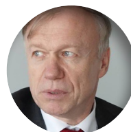
Rolf Nickel Botschafter Deutschlands seit 2014