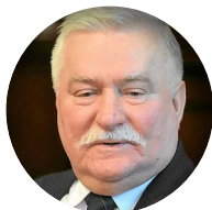
Lech Wałęsa Präsident Polens 1990-1995