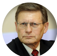
Prof. Leszek Balcerowicz Vater der Wirtschaftsreformen in Polen nach 1989