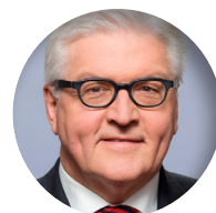
Frank-Walter Steinmeier Präsident Deutschlands seit 2017