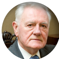
Valdas Adamkus Präsident Litauens 1998-2009